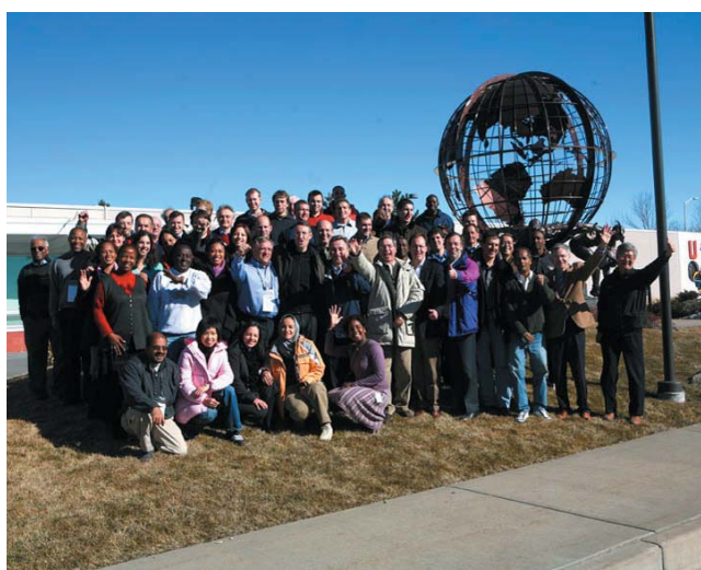
MEMOS X à Colorado Springs (USA) MEMOS X en Colorado Springs, USA MEMOS X in Colorado Springs, USA

T he MEMOS is an executive master which is offered in three editions according to the teaching language: English, French or Spanish. Generic information on each of the three editions is provided below in the respective language. For specific information on the current editions, please refer to the leaflets inserted in the middle of this brochure.